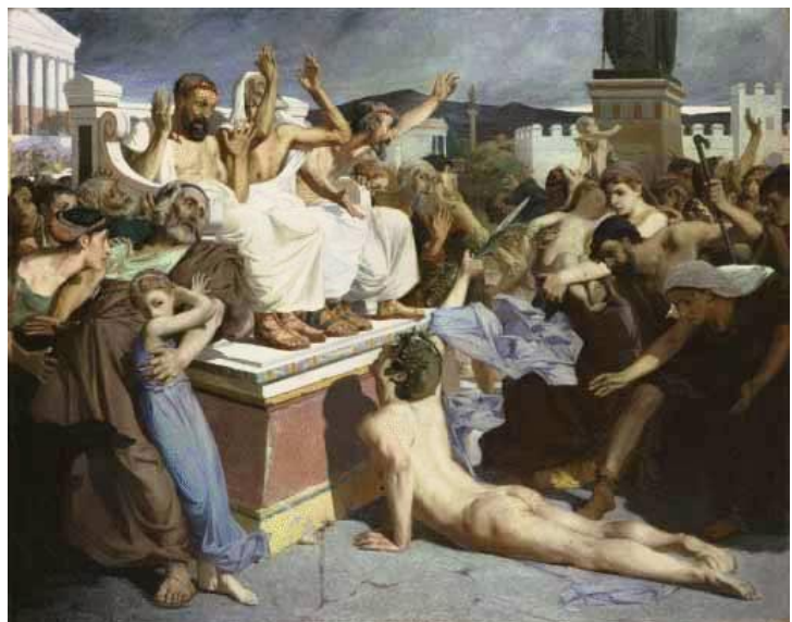
Vaso griego de figuras rojas con un soldado a la carrera. Al lado, pintura de Filípides llegando a Atenas, por Luc Olivier Merson (1869).