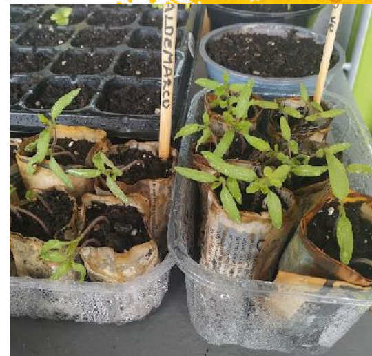
Invernaderos con botellas de plástico y semilleros de periódicos reutilizados.