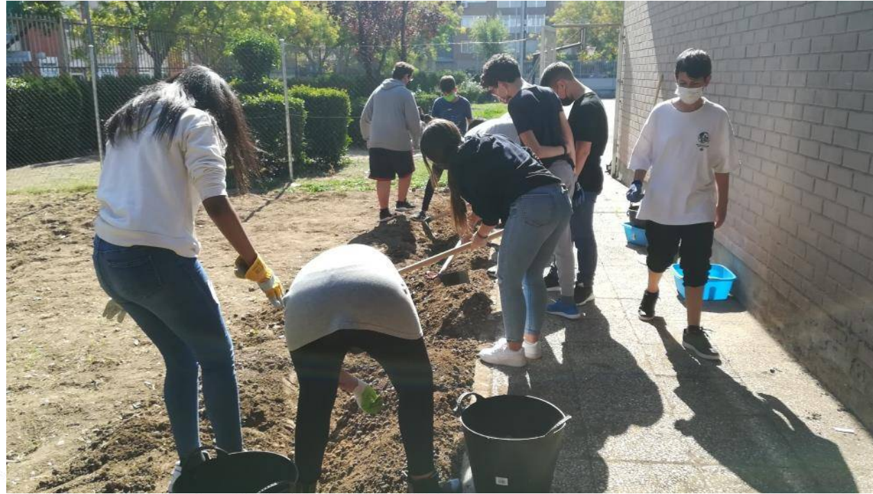
Preparación del terreno y limpieza.