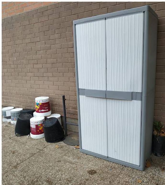
Armario para guardar herramientas. Cubos de pintura limpios para recoger, tierra, malas hierbas, agua, etc.