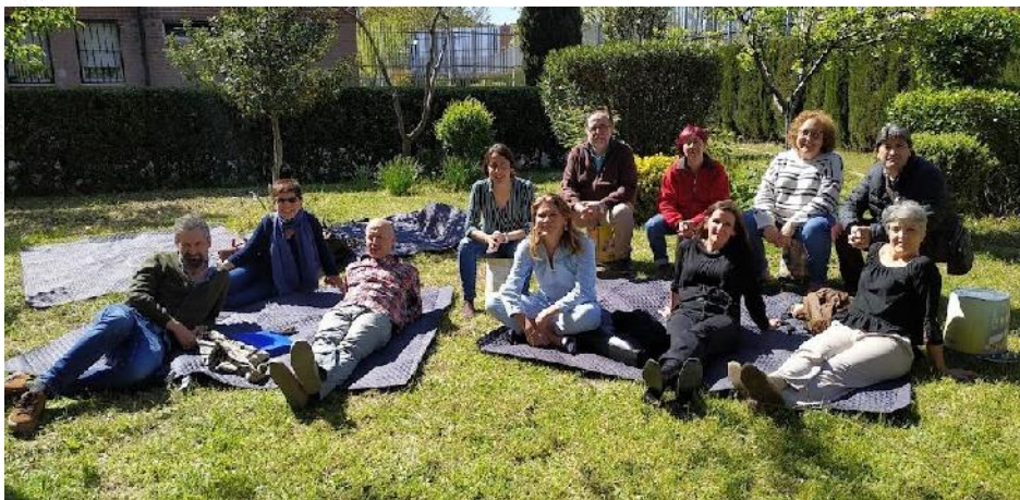
Mantas de picnic y cubos de pintura reutilizados como asientos para poder trabajar en grupos.

La escalinata es por sí misma un pequeño escenario donde se puede realizar algún concierto o recital de agrupaciones pequeñas o solistas, mientras que el público puede sentarse en el suelo, en unas mantas de campo, o sentarse en asientos de reciclaje. Todo el material se guarda en un pequeño espacio de almacenaje que hay en el interior del edificio, junto a la puerta.