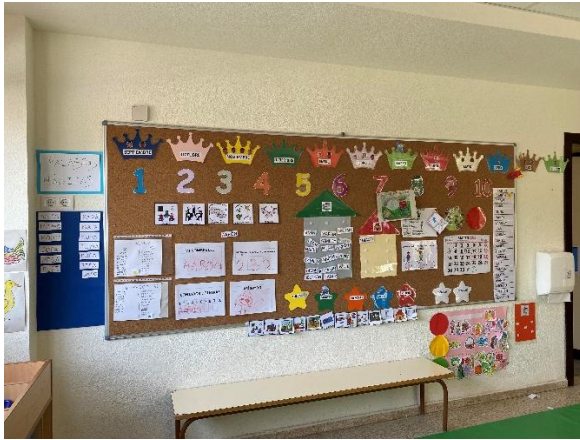
En la asamblea de E. Infantil 4 años.