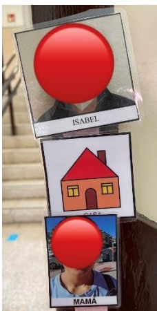
Anticipación de ir a casa de un alumno.