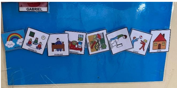
Anticipación del día de un alumno.