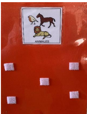
Juego por Rincones.