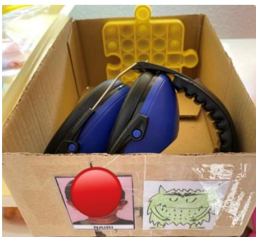
Caja de relajación de un alumno.