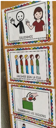
Normas del aula.