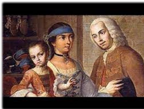
Español y mestiza s. XVIII Miguel Cabrera México Museo de América Madrid

Mientras tanto, en Europa el poderío del imperio despierta la inquietud de otras naciones, que utilizan, entre otras armas, la propaganda, difundiendo información tergiversada y descontextualizada de los hechos históricos, generando así la leyenda negra .