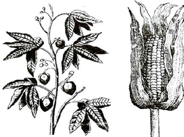
Tapioca y el maíz, según dibujos de 1648 y 1556

Francisco Cervantes de Salazar , en su Crónica de la Nueva España (1575), recoge multitud de indoamericanismos o indigenismos de las nuevas tierras que hacen referencia a muchos ámbitos de la vida. ¿Puedes poner ejemplos de indigenismos y de qué lenguas indígenas procedían? ¿Qué palabras te ha resultado más curioso descubrir que no formaban parte, originariamente, de la lengua castellana?