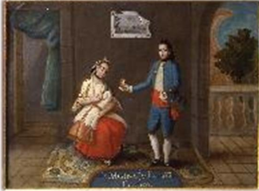
Pintura de castas s XVIII. Anónimo. Museo de América

El descubrimiento de un Nuevo Mundo plantea nuevos problemas y necesidades en las tierras de ultramar a las que se da respuesta mediante nuevas leyes y desde instituciones como la Universidad de Salamanca, momento en que alcanza su máximo esplendor.