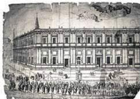
Casa de la contratación de Indias

Desde un punto de vista geográfico , ¿cómo se consigue realizar un mapa mundi si no hay satélites ? (39'47"- 50')