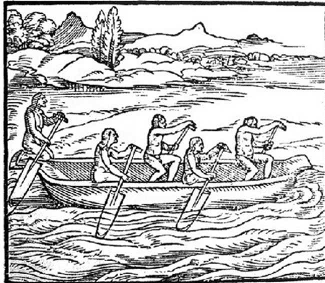
Grabado de la Historia del Nuevo Mundo, de M. Girolamo Benzoni, 1563.

¿Cómo interpretas la última frase que aparece en el documental: " ahora más que nunca, la lucha por el pasado es la lucha por el futuro "?