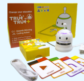
Modelo 3: TRUE TRUE