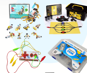
Modelo 4A: Nezha Modelo 4B: Micro:bit Modelo 5: ART2BIT de Jovi Modelo 6: Makey Makey Modelo 7: Crumble