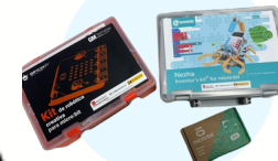
Modelo 8A: Nezha Modelo 8B: Micro:bit Modelo 9: Kit Robótica Creativa