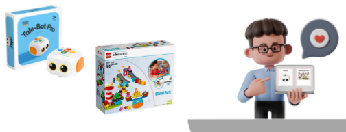
Modelo 1: Tale-Bot Pro Modelo 2: Lego Steam Park