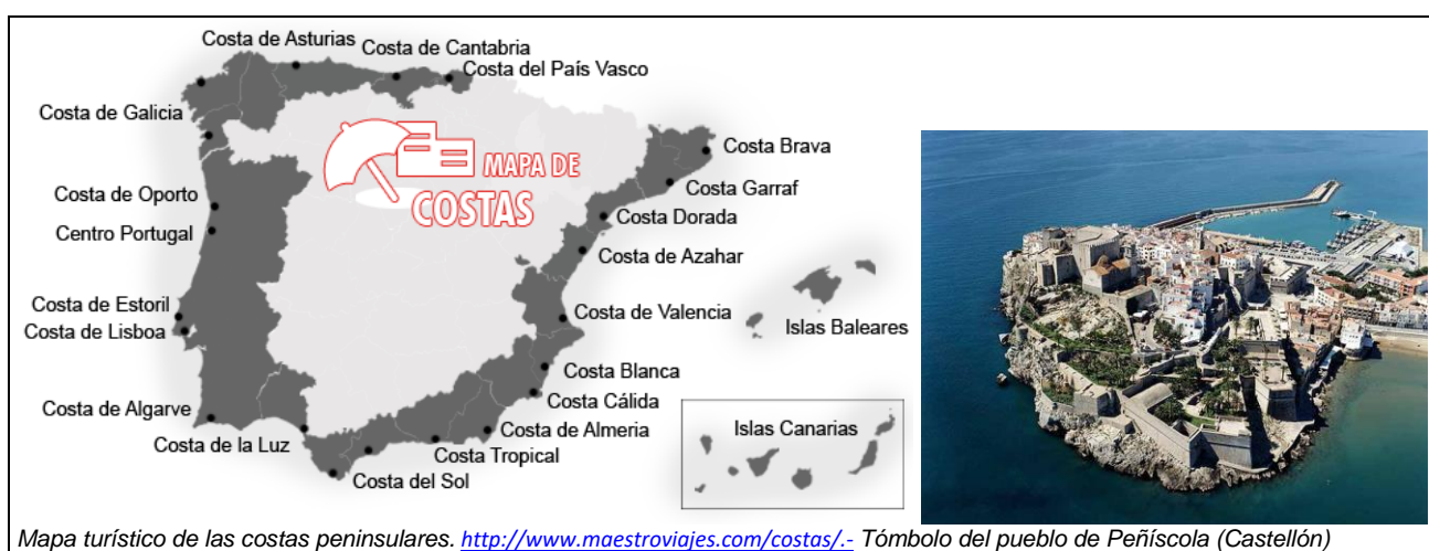
Mapa turístico de las costas peninsulares. http://www.maestroviajes.com/costas/ . Tómbolo del pueblo de Peñíscola (Castellón)