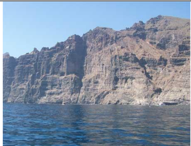
Acantilado de los Gigantes (Tenerife, islas Canarias)