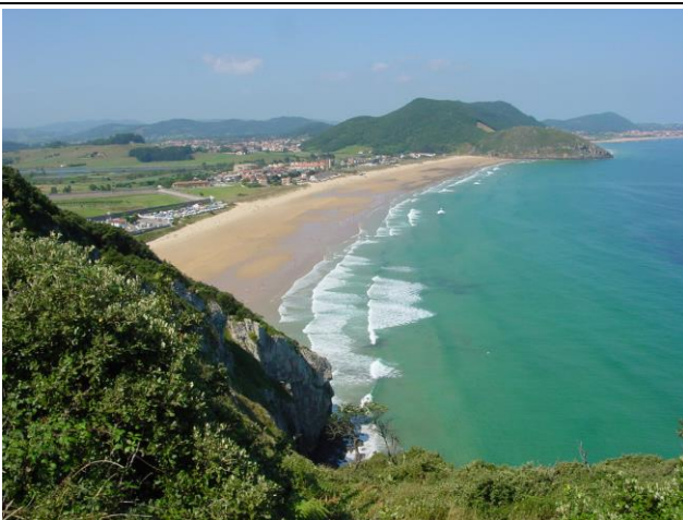
Playa de Berria en Santoña (Santander, Cantabria).