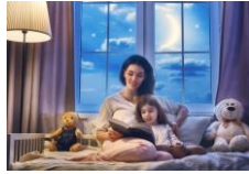
Esta foto está bajo licencia CC BY

Buscaremos un lugar tranquilo, sin ruidos, y un momento relajado, intentando que lo principal sea el cuento y ese momento compartido. Es ideal antes de dormir, pero a lo largo del día se pueden buscar diferentes momentos, incluso para lograr que el niño se relaje, o calme, después de una actividad especialmente activa (por ejemplo, al volver del parque).