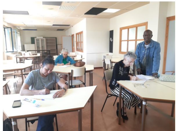
Grupo de Francés

El taller se está dando por un profesor que está dispuesto a ayudar a todas las personas que quieran estudiar el francés con carácter no lucrativo. ¡Animaos a participar para el curso 2022-23!