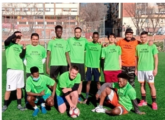
Equipo de Fútbol 7