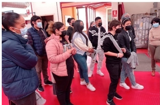
Visita al IES Puerta Bonita