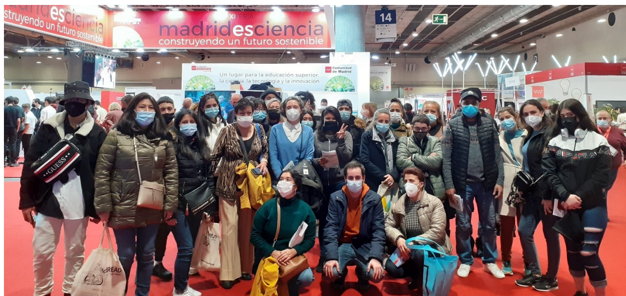
“Madrid es Ciencia”. IFEMA