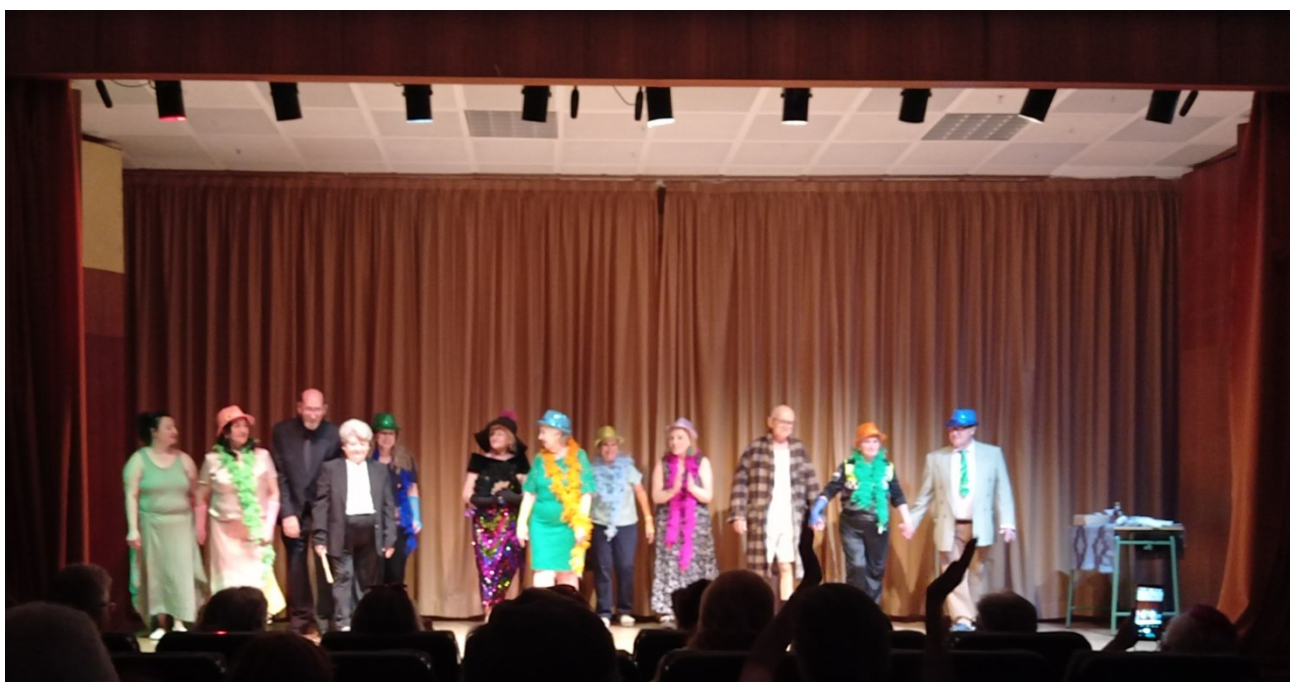
Grupo de Teatro ACCA-Vista Alegre tras su interpretación de "La visita de la vieja dama"

Nuestro método de trabajo se basa en una preparación actoral a partir de juegos que fomentan la imaginación y la técnica, que luego llevamos a la práctica en el montaje