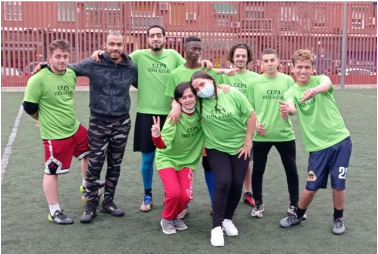
Equipo de fútbol 7