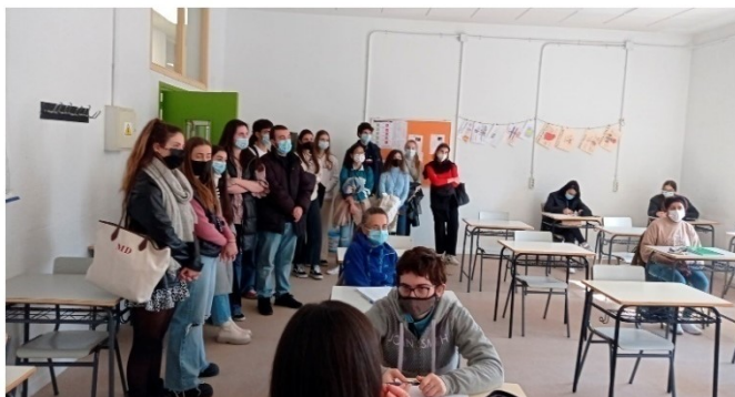
Visita Pedagogos del CES Don Bosco