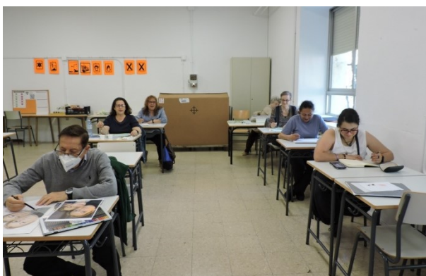
Clase de dibujo y pintura

En este curso se han empezado las clases de dibujo y pintura un poco despacio pero poco a poco han ido cobrando fuerza y se ha incrementado el número de personas inscritas en él y esperamos que la siguiente temporada no solo sigan los alumnos actuales, sino que se vayan apuntando más personas y se pueda hacer un grupo más grande.