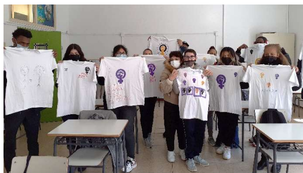
Alumnos de FPB el 8M