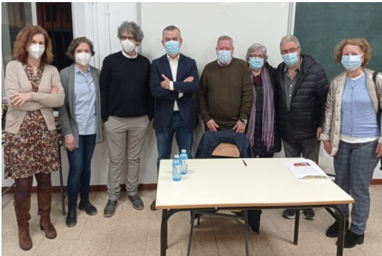
“Tertulia literaria” con Lorenzo Silva