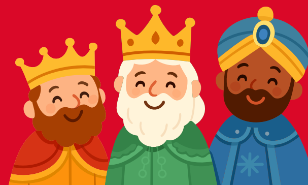
Three Wise men