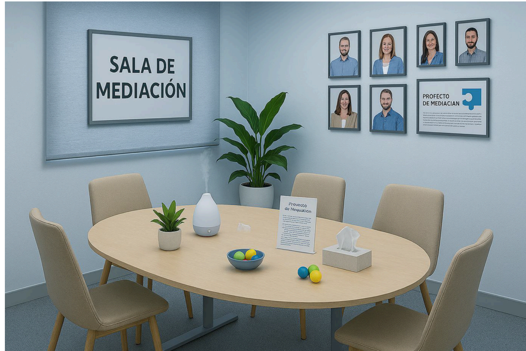
Propuesta de sala de mediación