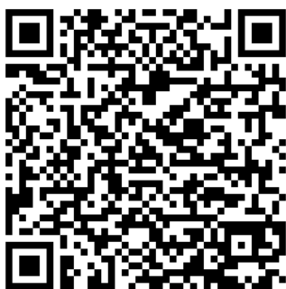
Plantilla de Dibujo

Códigos QR de acceso a los materiales para imprimir: