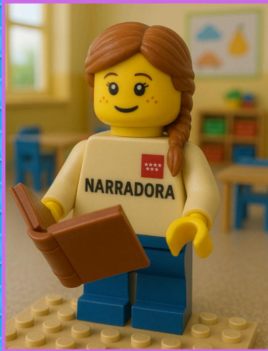
NARRADOR/A (Cuenta la historia o el proceso)