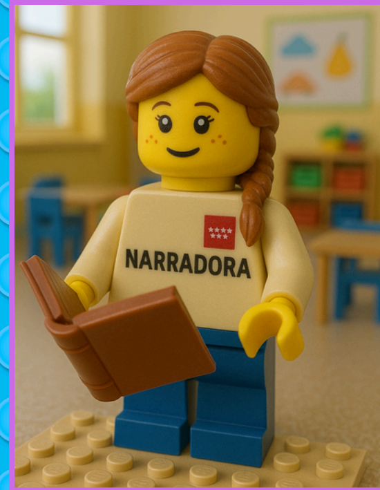
NARRADOR/A (Cuenta la historia o el proceso)