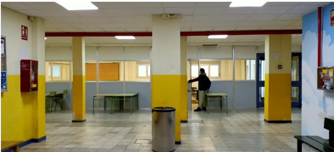
Figura 4. Nodo 13 después de la retirada de los paneles opacos de las mamparas.