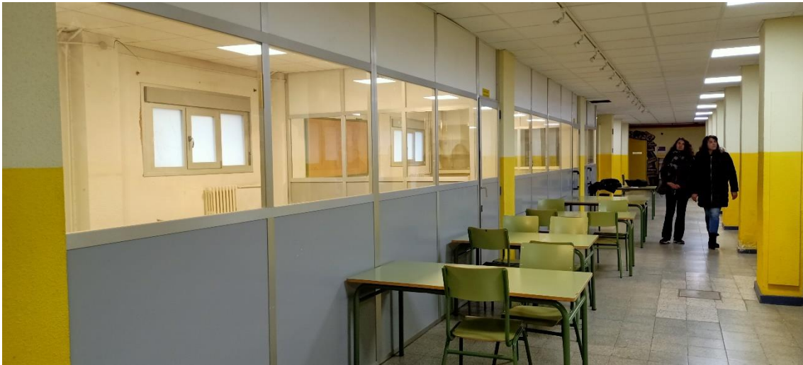
Figura 3. Nodo 13 después de la retirada de los paneles opacos de las mamparas.