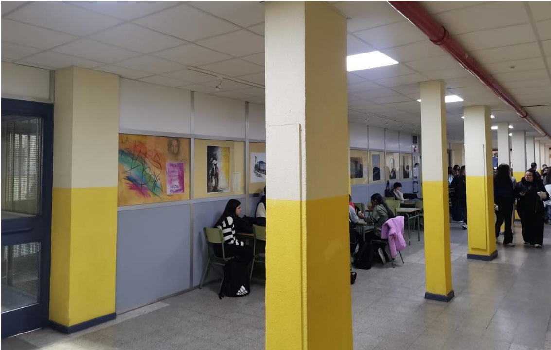
Figura 2. IES Antonio Machado. Nodo 13 antes de la actuación del Taller de Arquitectura Educativa.