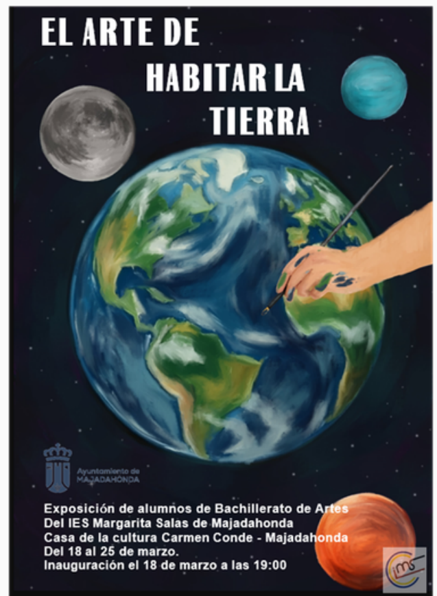
Cartel realizado por Alejandra Martínez San Francisco