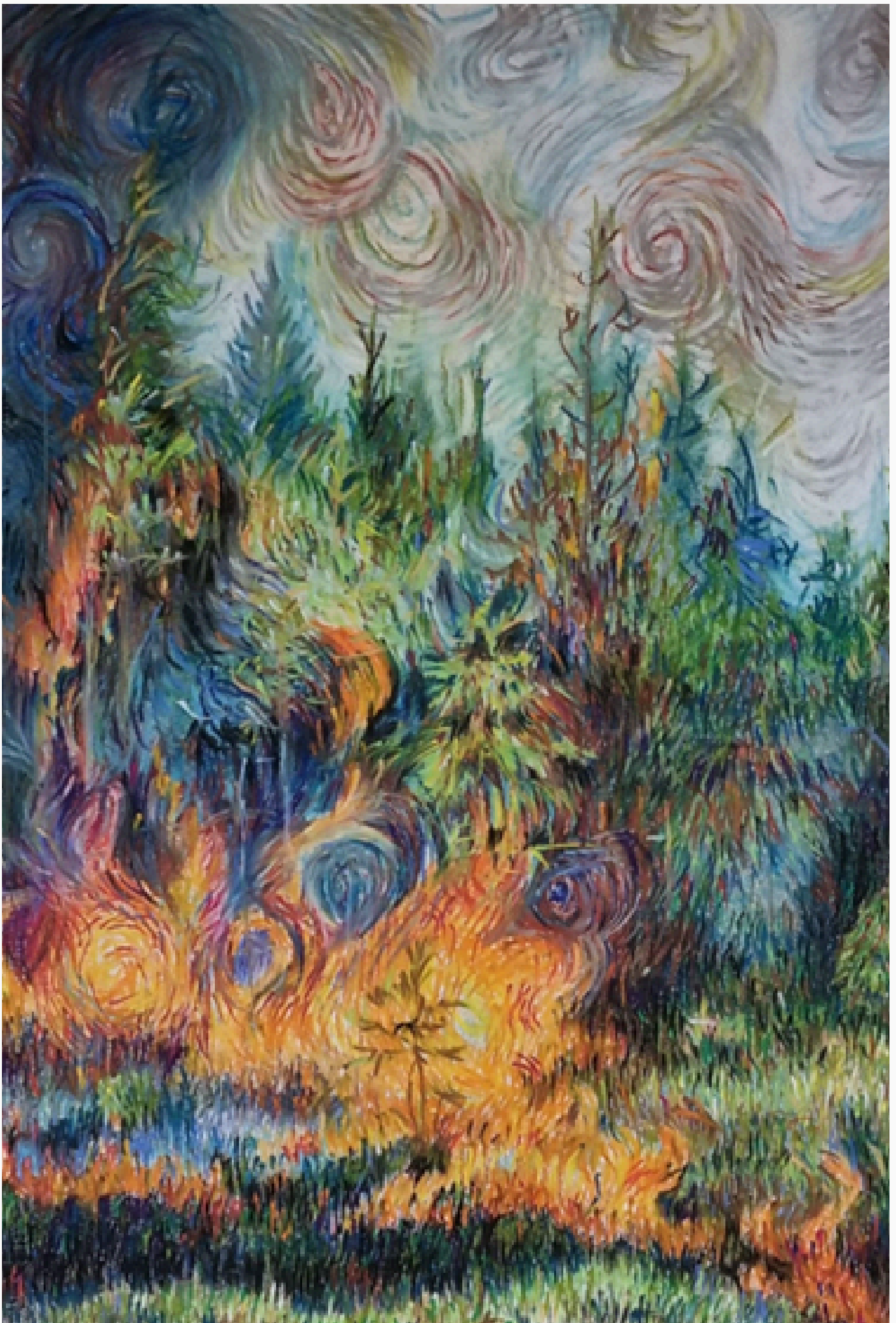
Dibujo realizado por Ana Sroka Milla