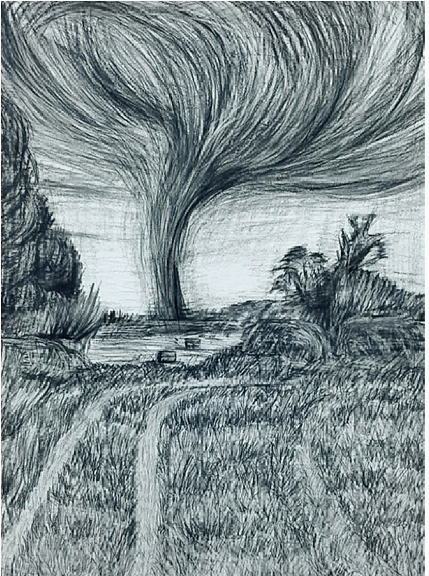
Dibujo realizado por Natalia Abbad Jaime de Aragón Sánchez