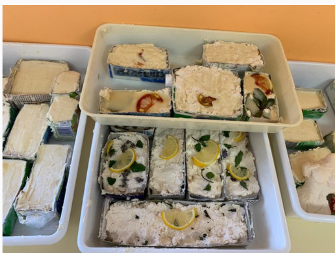
FIGURA 3. Resultado final de jabones realizados con briks reciclados y aromatizados con frutas, aceites esenciales y hierbas aromáticas.