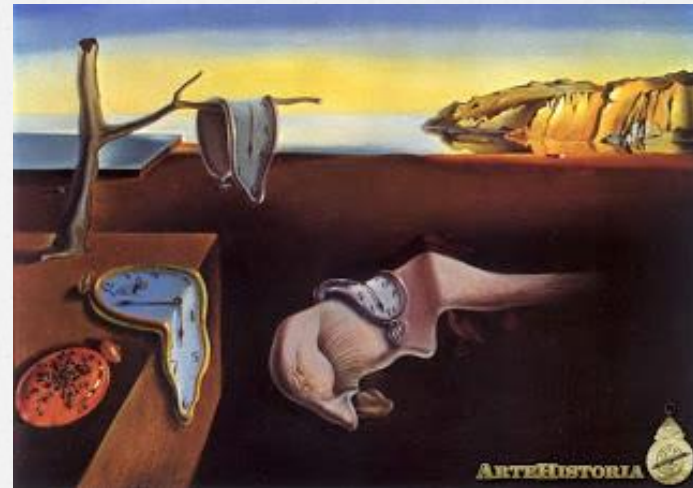
La persistencia de la memoria (Salvador Dalí)