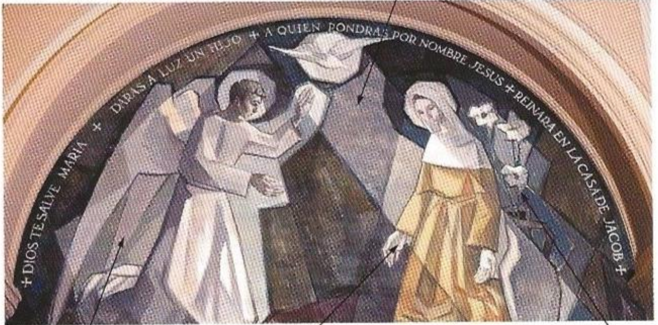
Anunciación. F. Triás y R. Roca.

Los personajes con alas son los mensajeros de Dios. La postura de rodillas es la de adorar.