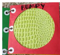
LIBRO DEL TACTO CON