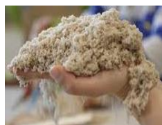
MASAS SENSORIALES CASERAS