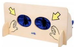
PARED DEL TACTO