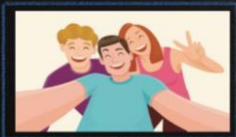
Sabe relacionarse con los/as demás