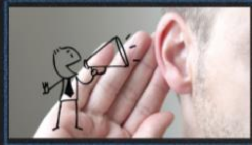
Sabe y quiere escuchar y ayudar