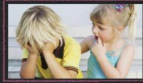
Se pone en la piel de la otra persona