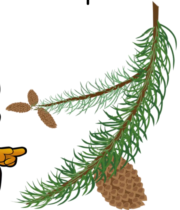
La ardilla Pilla