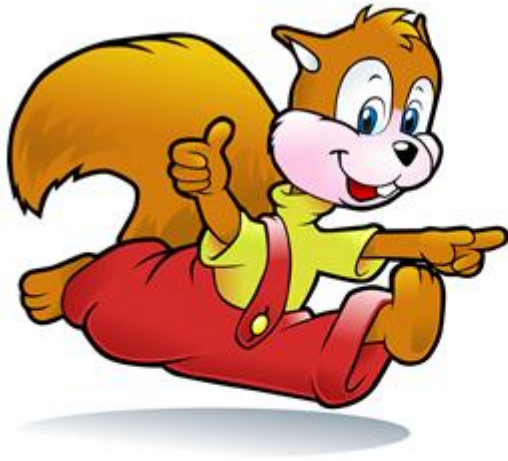
La ardilla Pilla

Había una vez una ardilla que vivía en lo alto de un pino muy, muy grande.