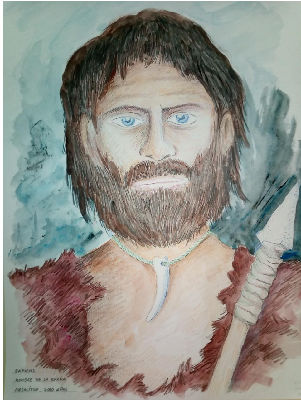
SAPIENS HOMBRE DE LA BRAÑA MESOLÍTICO. 7000 AÑOS