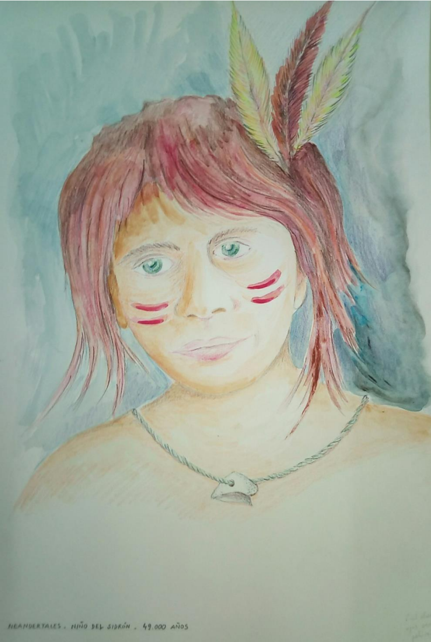
NEANDERTALES . NIÑO DEL SIDRÓN . 49.000 AÑOS