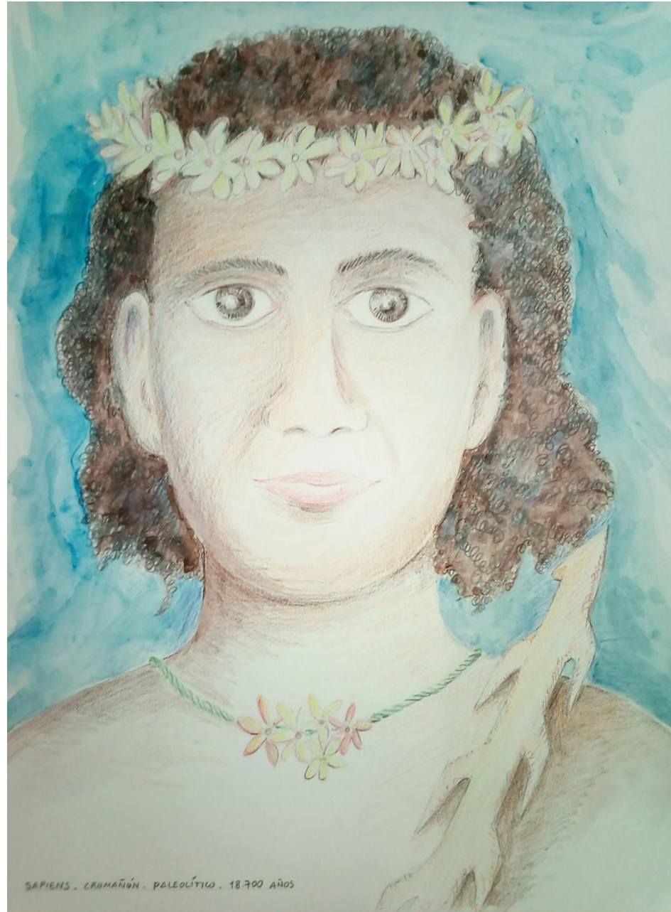
SAPIENS - CROMAÑÓN - PALEOLÍTICO - 18.700 AÑOS