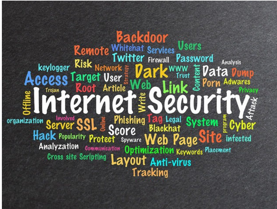
Internet Security Word Cloud by Mike Corbett in Flickr

En esta actividad conoceremos qué es lo que sabemos sobre seguridad informática para después profundizar en estos temas y que no “nos tomen el pelo por la red”.