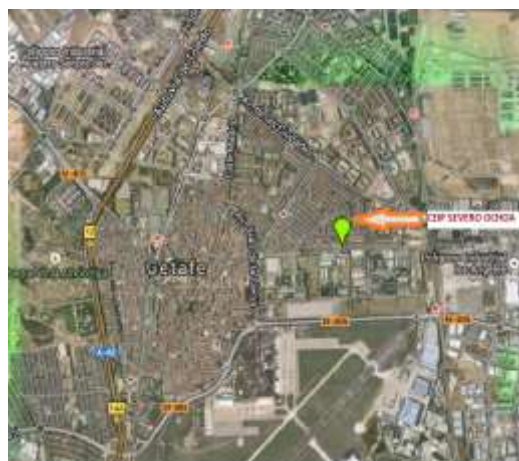
Figura 1. Ubicación del centro

Actualmente Getafe consta de más de 175.000 habitantes empadronados, que se distribuyen en las alrededores de 800 calles de que se compone el municipio.