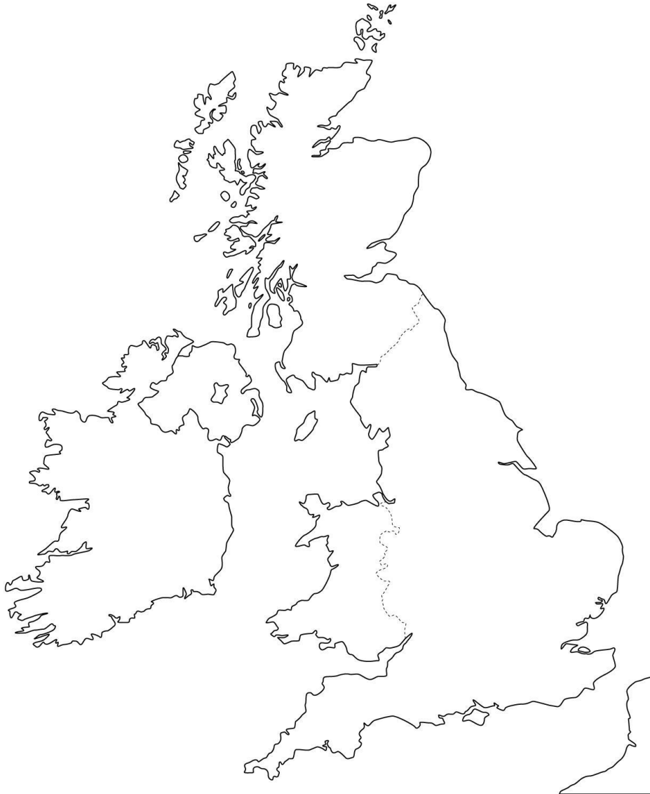
Mapa UK gran resolución limpio 1