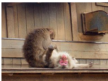
Marubatsu (lic.CC BY-SA 3.0)

El autor de este texto, un conocido etólogo, expone un ejemplo de comportamiento cultural (un comportamiento transmitido socialmente, y no genéticamente) de algunos primates. Muestra cómo surgió y los cambios sufridos a lo largo del tiempo.