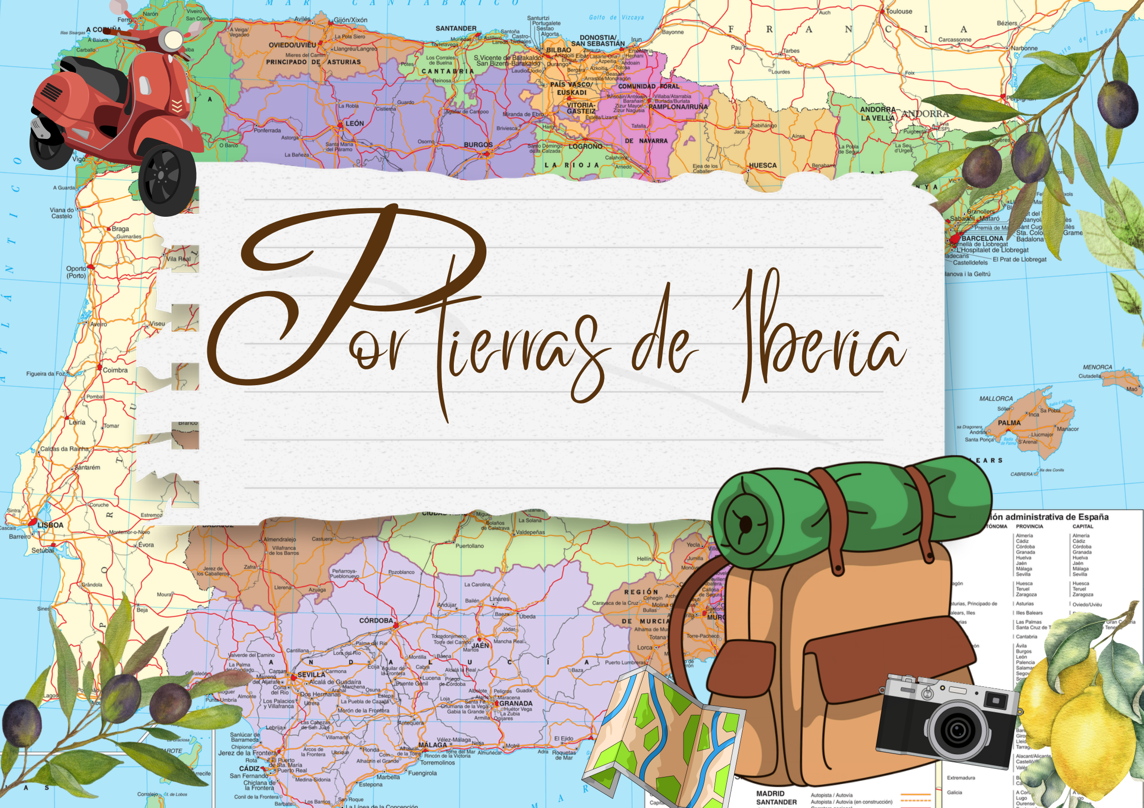
División administrativa de España