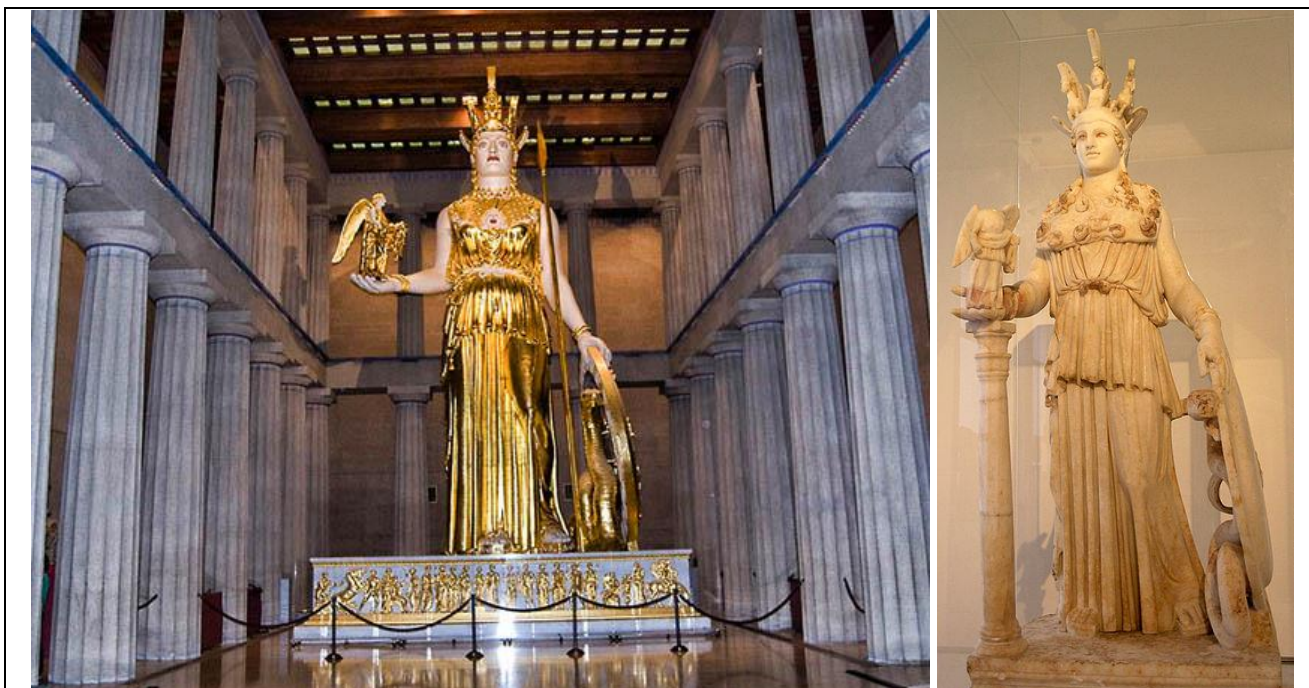
Atenea Parthenos que se encuentra en el interior de la réplica del Partenón en Nashville.

Fidias sobresalió tanto en la escultura exenta como en el relieve. La primera obra que se conoce de él es la Atenea Lemnia , una estatua de la diosa destinada a la Acrópolis de Atenas, de la que se conservan dos copias parciales: un busto en el Museo Arqueológico de Bolonia y una figura casi completa en el Albertinum de Dresde. Tras esta probablemente realizó la gran Atenea Prómacos en bronce, para la Acrópolis, de la que no nos han quedado más que descripciones de la misma. Se alzaba sobre un pedestal y medía entre 7 y 12 metros, siendo visible desde el puerto de El Pireo.