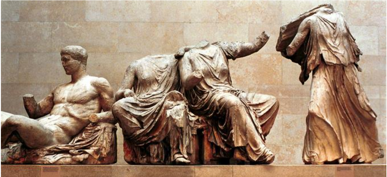
Restos del tímpano donde se representa el nacimiento de Atenea. Museo Británico.

Todo el Partenón estaba policromado: metopas y frisos en rojo, frontones en azul, figuras con los ojos y cabellos pintados. La mayor parte de las esculturas del Partenón se conservan en el Museo Británico.