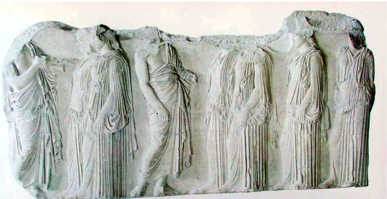
Dioses del desfile de las Panateneas, portadores de ofrendas y las doncellas Panateneas. Friso corrido que rodeaba el Partenón.

Pero lo que engrandeció el nombre del artista ya en su tiempo y ha mantenido inalterada su fama a través de los siglos son las esculturas del Partenón. Finalizada la construcción del templo, Fidias y su taller se ocuparon de toda la decoración escultórica. Se cree que las esculturas de Fidias estaban realizadas en arcilla o yeso, para que después sus alumnos las pasaran a mármol, aunque la maestría con la que están hechas algunas de ellas, evidencia la intervención directa del artista.