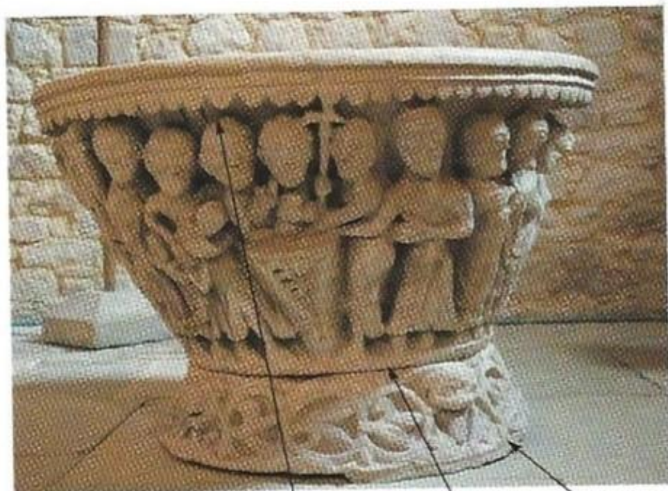
Pila bautismal románica.