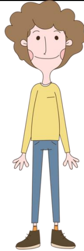
Papá de Lucía