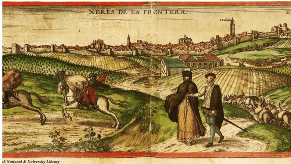
British National & University Library