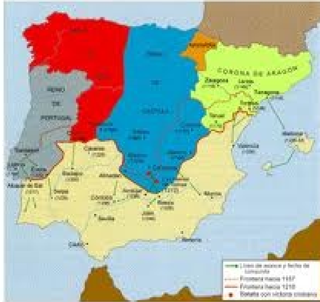
España, entre 1157 y 1212