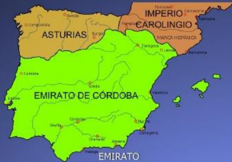
EMIRATO INDEPENDIENTE (756-929)