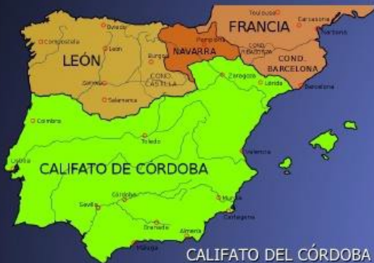
CALIFATO DEL CORDOBA (929-1031)