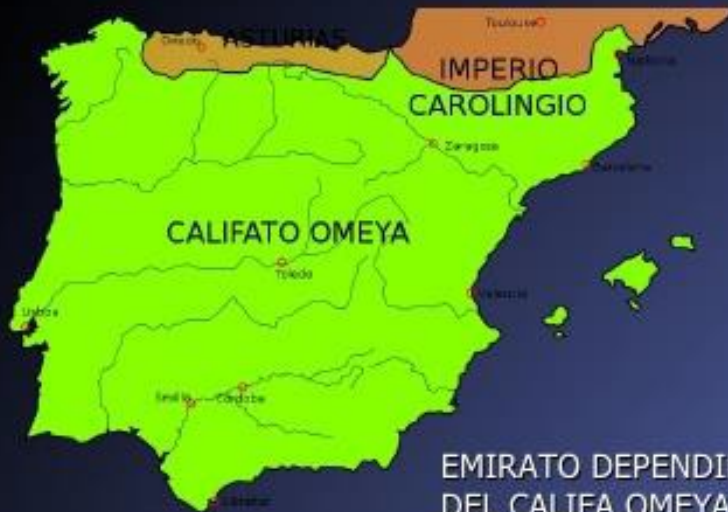
EMIRATO DEPENDIENTE DEL CALIFA OMEYA DE DAMASCO 711-756