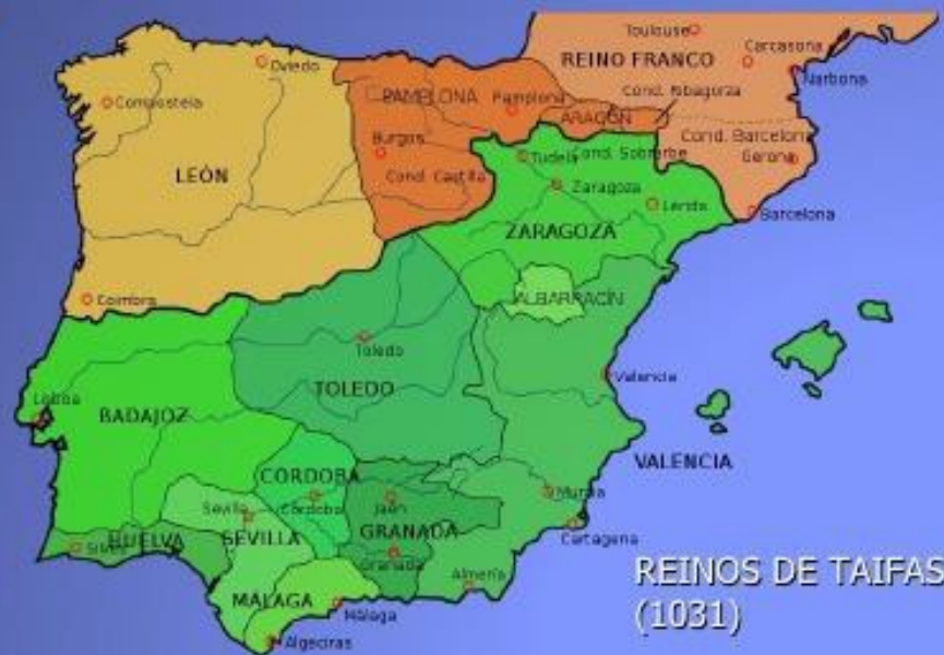
REINOS DE TAIFAS (1031)