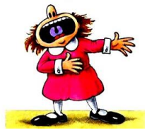
Esta foto está bajo licencia CC BY-NC-ND

Debemos cambiar la entonación: voz más aguda, más grave... en función del personaje.). También podemos utilizarlo para marcar los sentimientos: voz triste, voz alegre... e intentar que nos imiten.