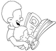
Esta foto está bajo licencia CC BY-SA-NC