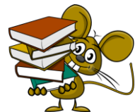
Esta foto está bajo licencia CC BY-SA-NC

Variar las fórmulas finales: "colorín, colorado, este cuento se ha acabado...", "y colorín, colorete, por la chimenea, sale un cohete", "y como este cuento ha llegado a su fin, ahora nos tenemos que ir a dormir...", etc.