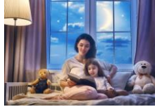
Esta foto está bajo licencia CC BY

Buscaremos un lugar tranquilo, sin ruidos, y un momento relajado, intentando que lo principal sea el cuento y ese momento compartido. Es ideal antes de dormir, pero a lo largo del día se pueden buscar diferentes momentos, incluso para lograr que el niño se relaje, o calme, después de una actividad especialmente activa (por ejemplo, al volver del parque).