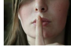
Esta foto está bajo licencia CC BY

Los silencios nos ayudan a reconducir la atención, ya que los niños nos avisarán de que debemos continuar. También creará momentos de interés, o tensión en el cuento, y los niños estarán deseando que pase, para poder seguir disfrutando del cuento.