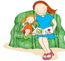
Esta foto está bajo licencia CC BY-SA-NC