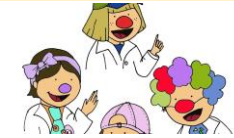
Esta foto está bajo licencia CC BY-NC-ND