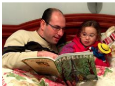
Esta foto está bajo licencia CC BY-NC-ND

Debe ser ni muy rápida, ni muy lenta. Esto favorece la atención de los niños. Lo ideal es hacerlo como si estuviéramos hablando.