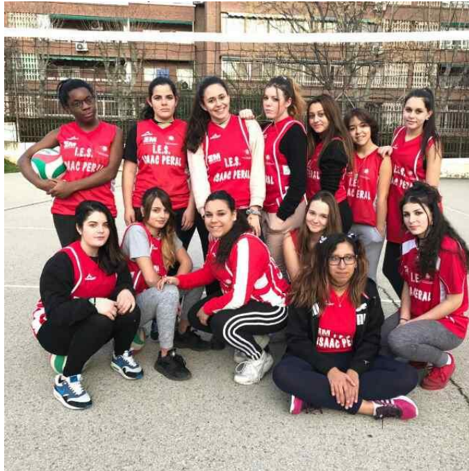
Las jugadoras de vóley del Insti

Desde Mundo Isaac animamos a nuestras jugadoras.