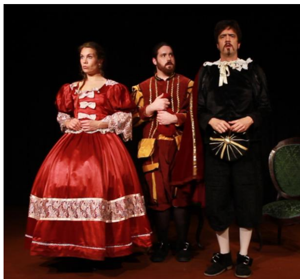
El vestuario de la foto no era como el que vimos...

El pasado martes 21 de marzo nuestro instituto organizó una excursión al Teatro municipal José María Rodero para ver la adaptación de la obra original de Lope de Vega, El perro del hortelano .