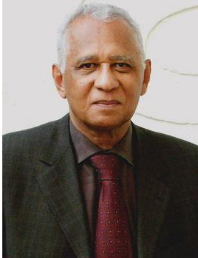
HENRI LOPES (Congo, 1937)