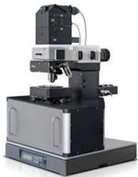
Microscopio cercano.

https://www.icrea.cat/es/Web/ScientificStaff/maria-f.-garcia-parajo-342 https://www.icfo.eu/research/84-group-member-details.html?gid=34&people_id=636 https://www.icfo.eu/research/groups-details?group_id=34