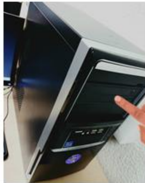
ESTO SE CONOCE COMO TORRE

Es una máquina electrónica que recibe y procesa datos, para convertirlos en información conveniente y útil. Puedes conectar USB y otros dispositivos.