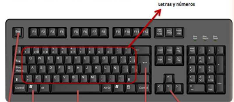
Letras y números

Es lo que se usa para escribir en el ordenador.