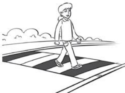
Cross the road