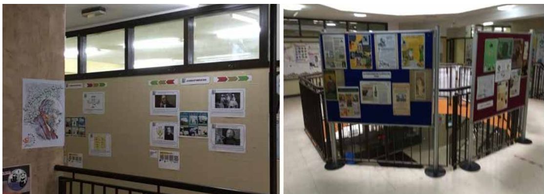
• Gran parte de las tareas realizadas por el alumnado fue expuesta en los espacios del centro. Toda la comunidad educativa pudo ver y evaluar el trabajo realizado

En este sentido el trabajo codo con codo del profesorado con los alumnos y alumnas fue un elemento vital porque reforzó el sentimiento de trabajo en equipo y definió claramente que el proyecto era “un objetivo compartido”. Se pasó a los estudiantes una encuesta de evaluación del curso y el proyecto fue uno de los elementos más valorados y del que más satisfechos se sentían. Usando palabras suyas diremos que esta experiencia ha supuesto un avance importante en su competencia digital.