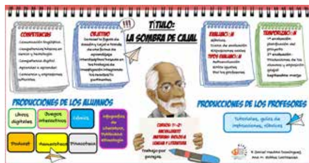
Resumen del proyecto en una imagen

Los autores de este proyecto somos conscientes de la importancia de contemplar e integrar las competencias básicas en cualquier proceso de enseñanza-aprendizaje, porque constituyen elementos que son claves en la perspectiva escolar, pues además de construir aprendizajes imprescindibles, el trabajo de las competencias favorece el encuentro entre disciplinas y contribuyen a desarrollar y ensanchar ese espacio común de entendimiento entre las diferentes áreas -no debemos olvidar que, en el proceso de aprendizaje, el receptor es único pese a que las disciplinas sean múltiples y que, en raras ocasiones, se adopta por parte del sistema educativo ese punto de vista.