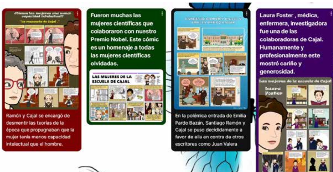
• Muestra de la colección de cómic realizada por el alumnado