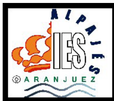
Logotipo IES Alpajés Aranjuez

Esta experiencia ha sido galardonada con el 2º Premio en la categoría Bachillerato modalidad B de los "Premios Nacionales a Experiencias Educativas Inspiradoras para el aprendizaje. Convocatoria 2022".