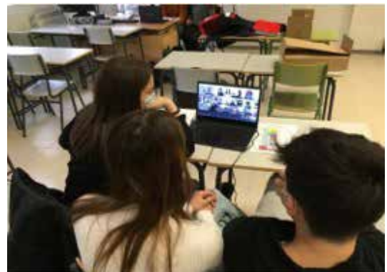
Alumnado trabajando de manera colaborativa en el aula de Informática

Vamos a contar a continuación los pasos seguidos para desarrollar el proyecto.