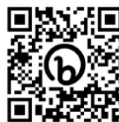
• Código QR de la web del proyecto

Cronológicamente podemos decir que se ocupó las fechas de septiembre a finales de marzo de 2022.