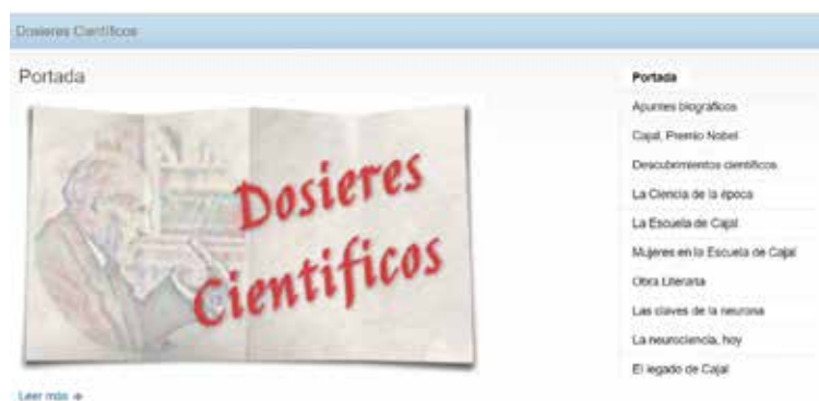
• Temáticas para los trabajos de investigación

La segunda fase del trabajo se corresponde con la producción de los alumnos y alumnas en la segunda evaluación. Estas tareas fueron variadas en cuanto a objetivos, estilos de aprendizaje, agrupaciones de estudiantes, etc.